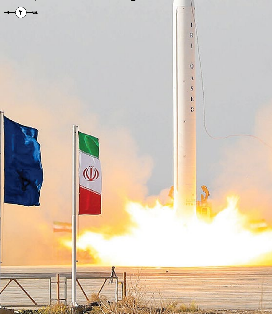
سومین ماهواره بومی نیروی هوافضای پاسداران انقلاب با نام «نور ۳» توسط ماهواره بر ترکیبی سه مرحله ای قاصد به فضا پرتاب شد